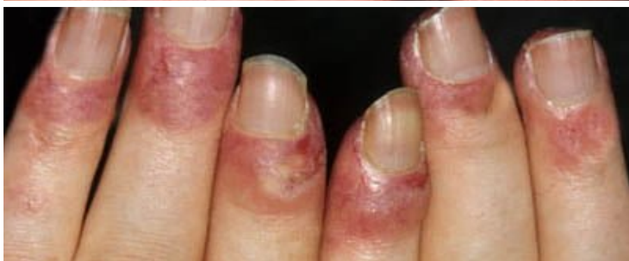
Eigenbilder von einer Klientin.